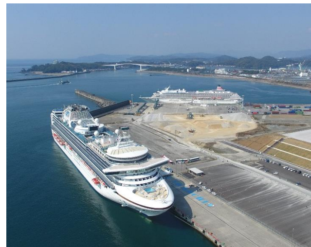
写真: (左)ダイヤモンド・プリンセス、(右)セブリティ・ミレニアム